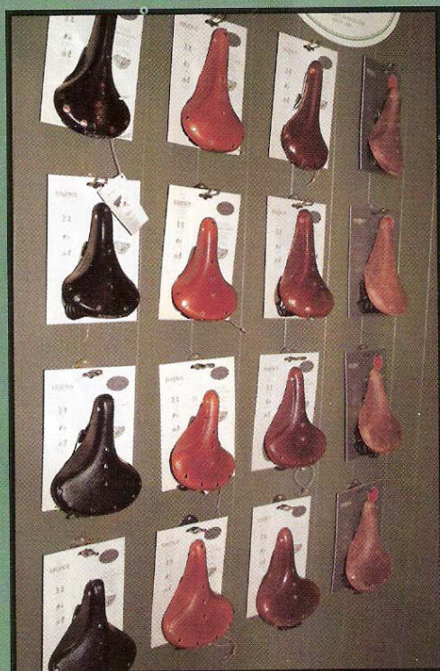
Les selles cuirs, cheval de bataille de la marque.